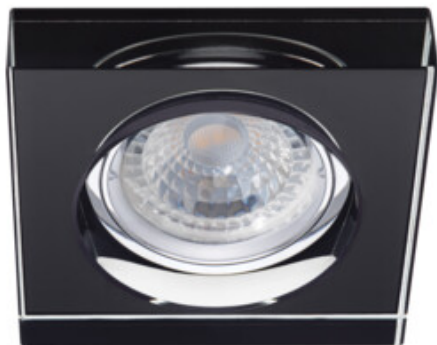
MORTA B CT-DSL50-B