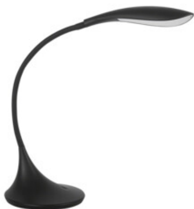
FRANCO 15LED SMD KT-B