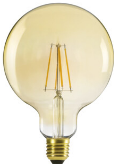
XLED G125 7W